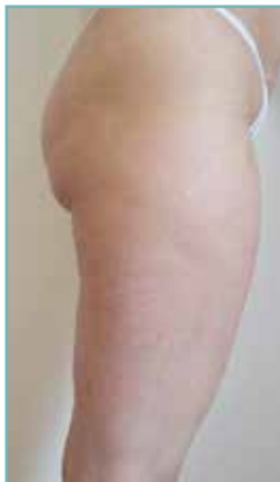
nach 5 Behandlungen

Eine professionelle Beratung und Behandlung erhalten Sie hier: