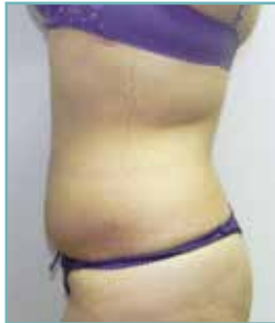
nach 5 Behandlungen