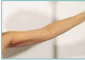
nach 6 Behandlungen